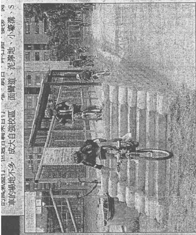
車的場地不多，成大自然校區、面彎道、泥濘地、小壕溝、S