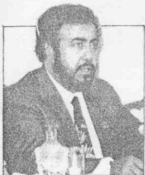
↑這是亞奧理事會主席法哈德，今年3月在日本札幌出席冬季亞運資料照片。

法哈德親王是在2日奮力抵抗伊拉克軍隊進占達斯曼王宮，遭射傷失血過多而死亡，他留有6名子女。