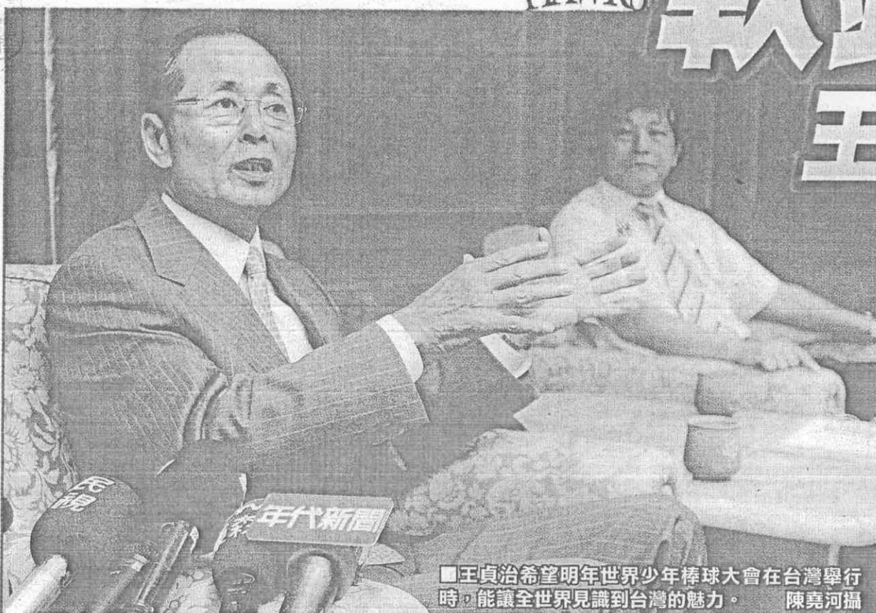
■王貞治希望明年世界少年棒球大會在台灣舉行時，能讓全世界見識到台灣的魅力。