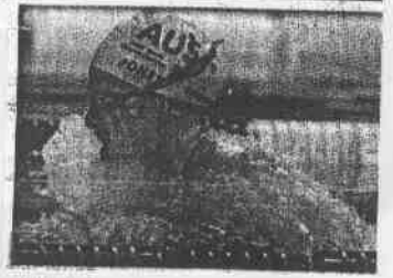
●北島以1分06秒37的成績刷新了女子100公尺蛙式的世界紀錄。