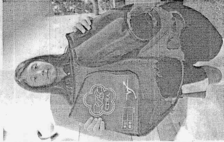
► 偏遠地區的宜蘭蓬萊國小拔河隊後位隊員所穿的護背衣已使用多年，脫線破損了，雖還能使用，但學生還是希望能有經費買件新的護背衣，出國比賽。