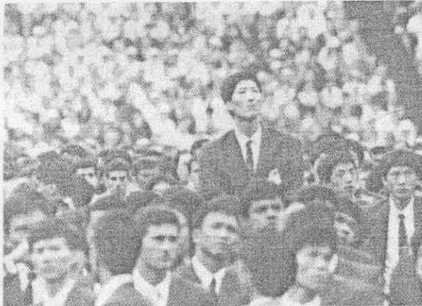
↑身高231公分的北韓男籃中鋒李明勛，22日在北京亞運開幕典禮中，高人一等地站在人群中。