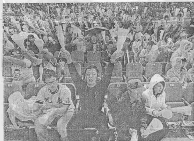
■球迷不畏風雨，賣力為象隊加油。

【姚瑞宸／台中報導】9局下1人出局，兄弟象王勝偉逮到SK飛龍救援投手宋恩範投出的第1球，掃出左外野線邊的二壘安打，壘上代跑的簡富智、朱偉銘飛奔回壘，象隊3比2逆轉戰勝南韓職棒總冠軍隊，取得台韓冠軍賽第1勝，自中華職棒總冠軍賽以來5連勝。