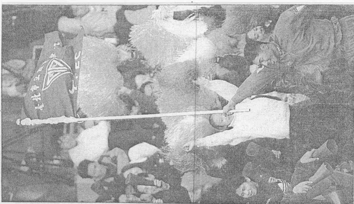
台北體院學生在梅花旗大學棒球賽為同學加油。