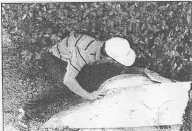
第合回二第杯太亞在他。球撈？麼什撈在浪志黃↑ 。忌柏雙了打，叢樹了進洞六十 。迷球多許引吸，兼良岸川手選距長的本日→