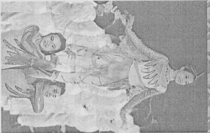
美麗女舞者吸引全場目光。