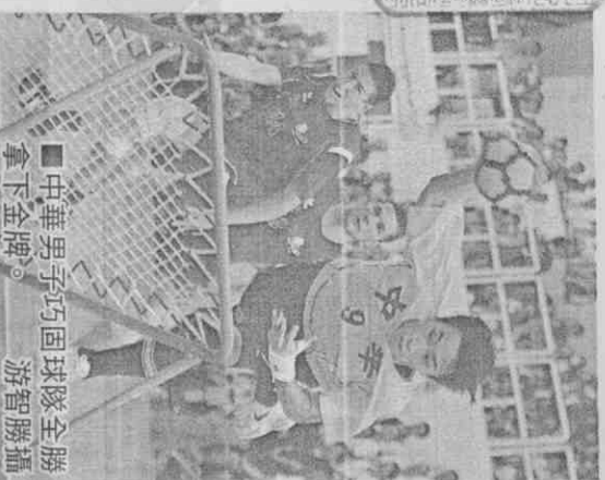
中華男子巧固球隊全勝拿下金牌。