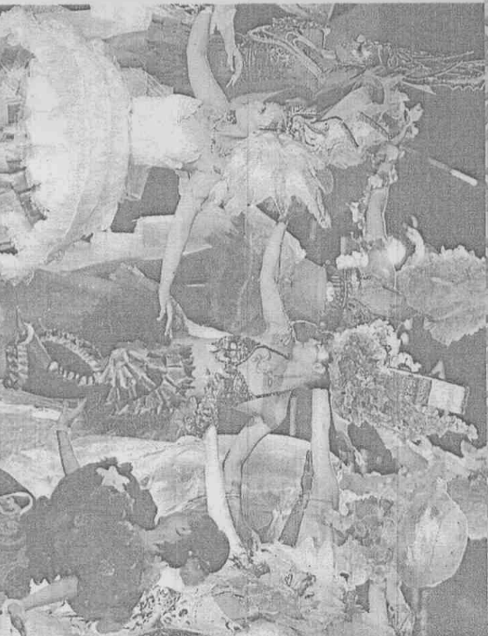
光電科技與舞蹈藝術結合，傳達「光影高雄」意念。