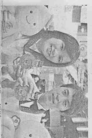
中華撞球隊最後只獲銀、銅牌。