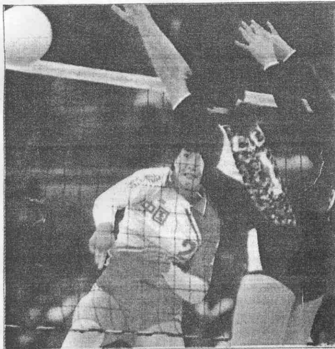
↑大陸女排重砲手李國君，是大陸隊寄託能擒服蘇聯隊的靈魂人物。