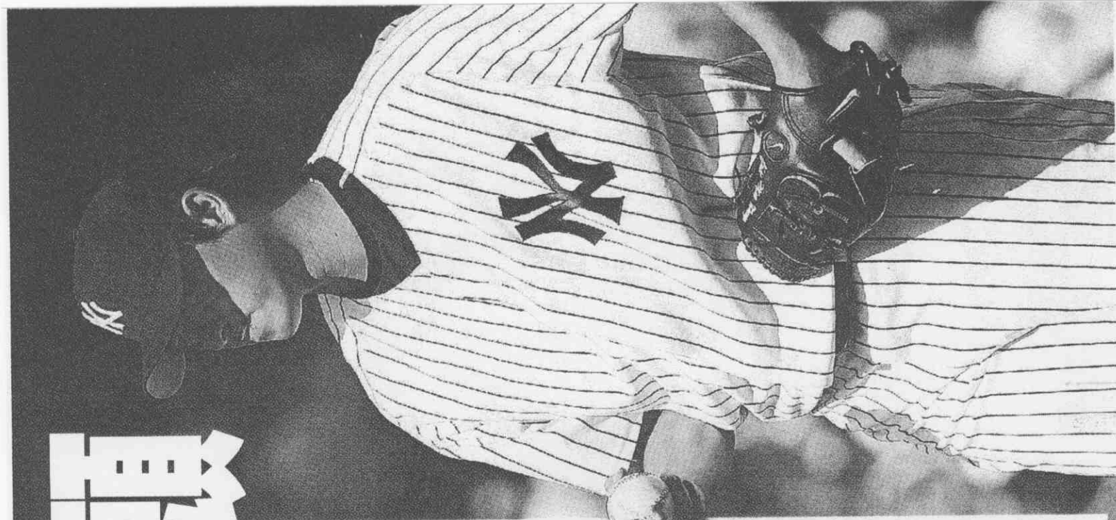
▶王建民榮膺洋基主場開幕戰先發投手，開賽前先琢磨握球的感覺。