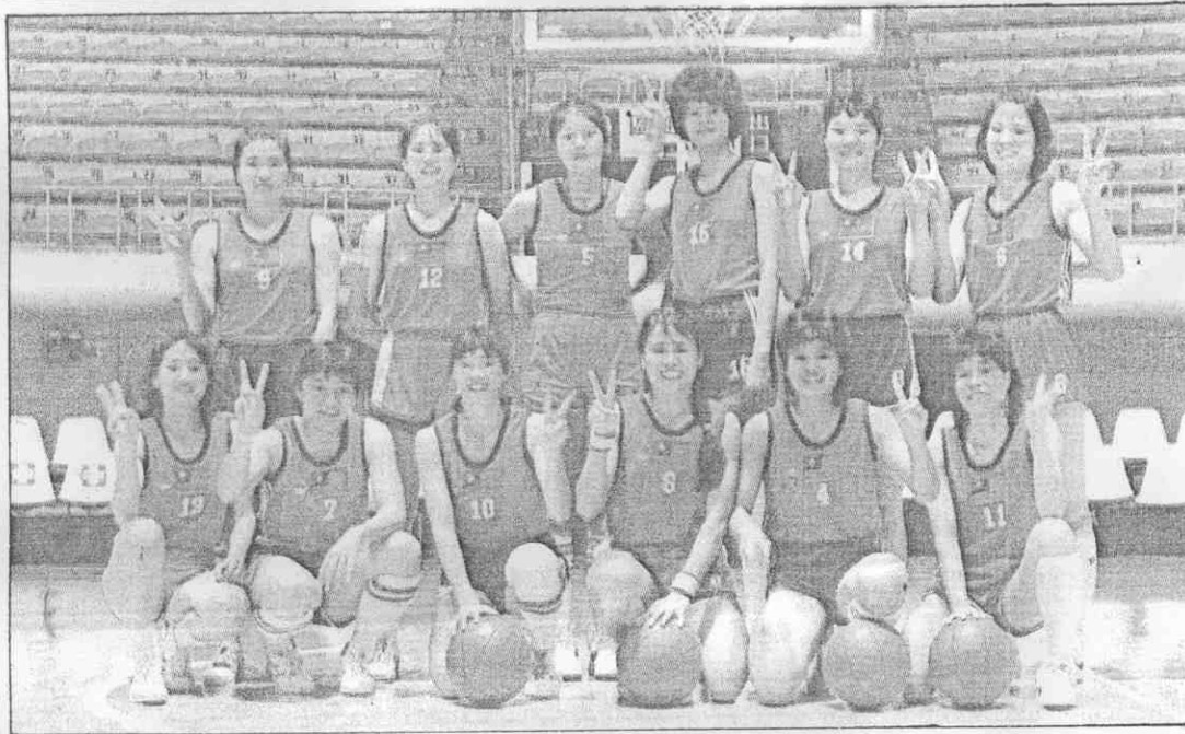
(攝興福張 者記報本)。球一的鍵關下投刻時後最在秀美林(左)。本日敗擊次首八十六比一十七以籃女華中(右)

【本報特派記者包勇敏吉隆坡八日專電】中華女籃終於在亞洲杯女籃賽創下新紀錄，以七十一比六十八戰勝日本隊，在亞洲杯得到第三名，同時首度取得參加莫斯科世界杯女籃賽資格。