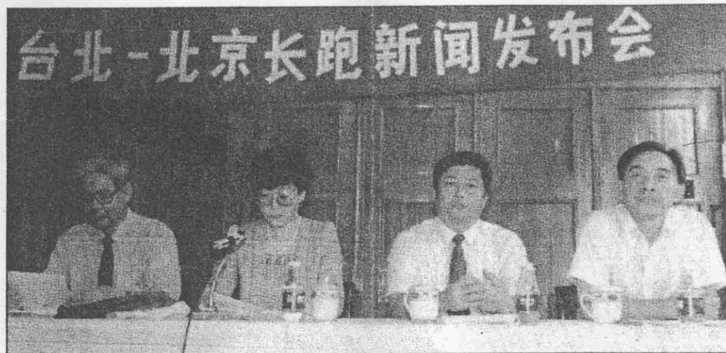
↑兩岸長跑舉辦在即，大陸方面昨在北京召開記者會。