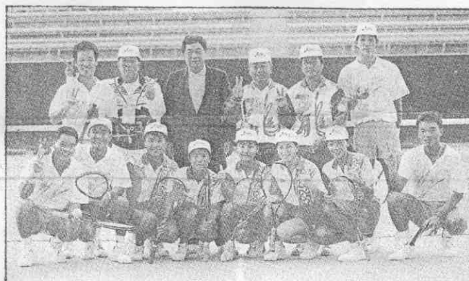
中華軟網隊練球前在中央球場合影。