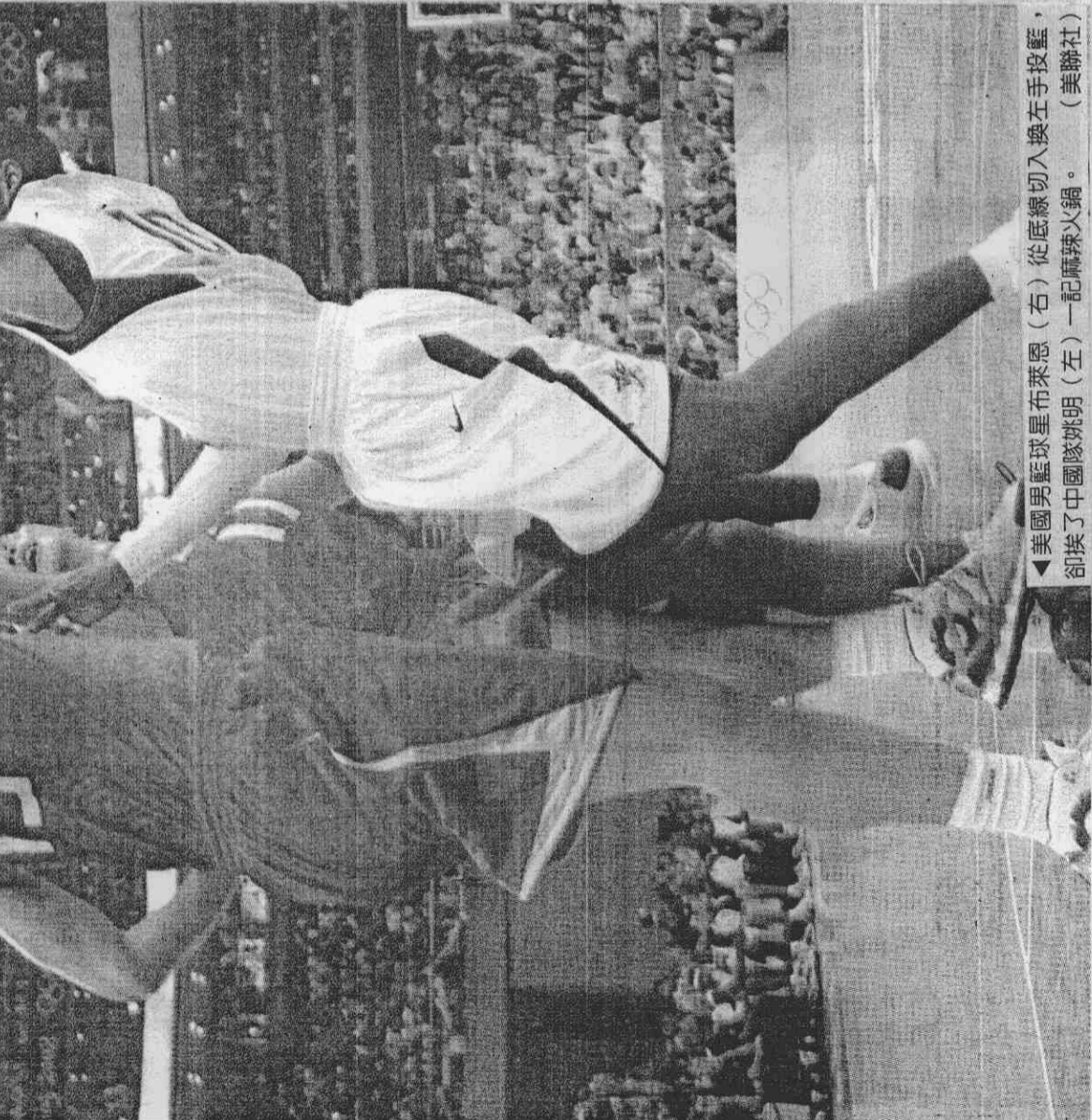
▲美國男籃球星布萊恩（右）從底線切入換左手投籃，卻挨了中國隊姚明（左）一記麻辣火鍋。