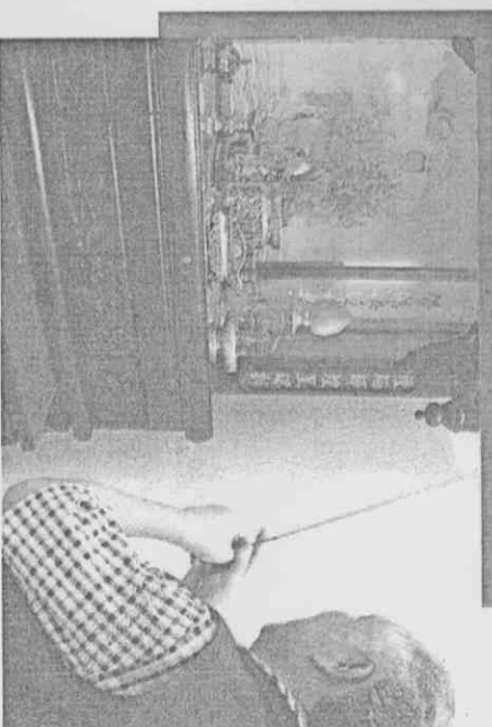
被視為台北聽奧中華保齡球代表隊金牌奪後推手——球館供奉的土地公，球館員工說，土地公回來很靈驗。