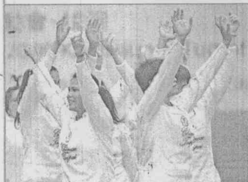
女子拔河520公斤級，台灣隊以全勝之姿奪金。

註：本屆世運採計分制，預賽進行2局，2局都贏的隊伍可獲3分，若雙方各贏1局，各獲1分，因此預賽可能出現的比數是3:0、0:3或1:1；準決賽和決賽連贏2局者勝出，同樣獲3分，若前2局雙方各獲1局，將進行第三局決勝局，因此準決賽和決賽可能出現的比數是3:0、0:3、2:1、1:2。