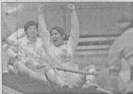
拿到勝利的那一瞬間，選手不禁舉手歡呼。