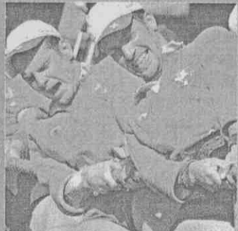
男子拔河瑞士隊的運動精神超感人

拔河比賽是雙方兩隊成員以默契、同心協力為勝利「出一份力」，按照世運比賽規則，雙方各有9名隊員，每場比賽8名選手上場，比賽時可替換球員一次，不過本屆高雄世運，出現了一場「7對7」的特殊場面。男子室外拔河640公斤級瑞士和德國的金牌戰，瑞士先贏一局，跟著德國一名選手受傷無法繼續比賽，但由於先前已換過一人，因此德國僅能以7人陣容出賽，瑞士隊了解情況後不想「勝之不武」，自願減少一位選手應戰，讓雙方能「7對7」公平競爭，最後瑞士隊再下一局，最終以3：0摘金，其運動精神更令人動容，獲得現場觀眾如雷掌聲。（記者陳筱琳）