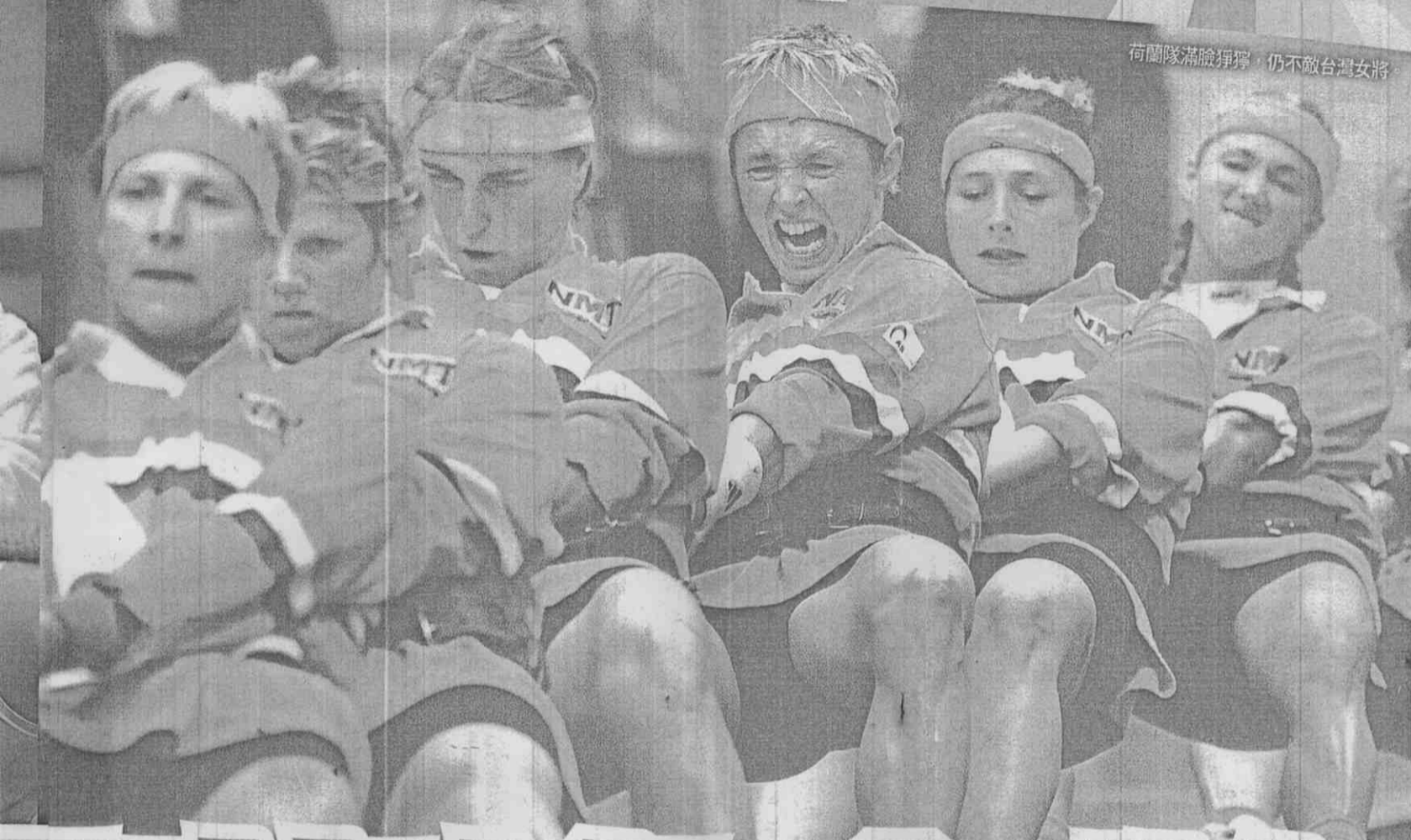
荷蘭隊滿臉掙扎，仍不敵台灣女將