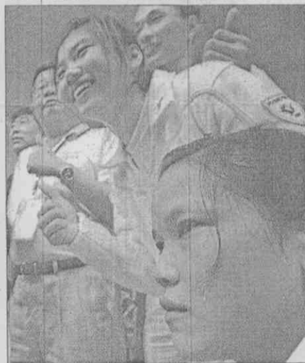
台灣隊選手用汗水、淚水換來勝利。