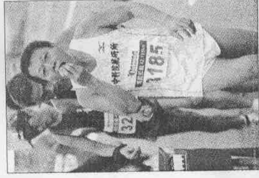
←馬拉松選手在補給站以雲林縣知名的柳丁補充能量。

兩次來台參加馬拉松，都碰上東北季風肆虐，不過比較起來，澎湖的風可以吹歪跑步路線，安東加納說，昨天的台西之風雖然迎面吹來，但小得多。