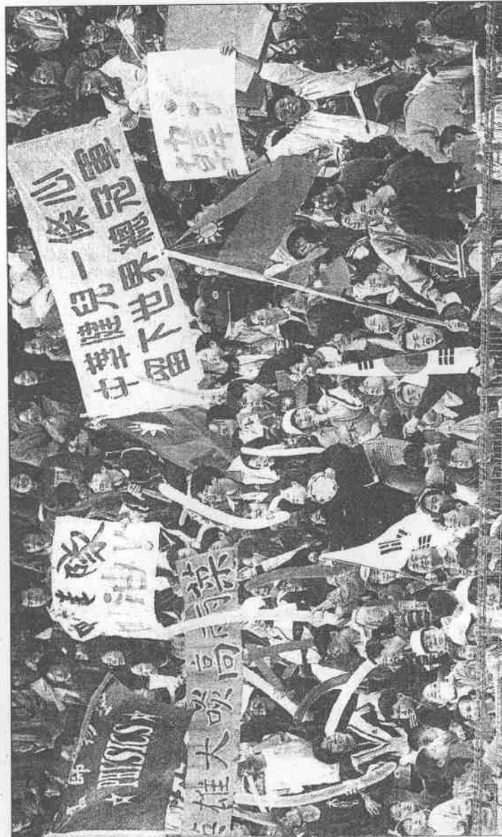
中華隊之戰，球迷帶來各式加油道具，熱情地為中華隊加油。

陳金鋒說，預賽前三場他擊出八支安打後，第四至六場無安打，昨天火力全開，他表示，三場無安打的比賽後，他覺得自己常打壞球，昨天的打擊原則是「不打不該打的球」，唯一例外是最後一支安打，那是個壞球，但還是形成安打。 南韓隊在六局上兩出局後開始抓中華隊先發投手張誌家的變化球，代打俞在雄及金周燦、李炳圭連續三安打，李炳圭有一分打點，但四棒馬海泳被張誌家三振，中華隊以五比一領先至終場獲勝。 相關新聞見三十版