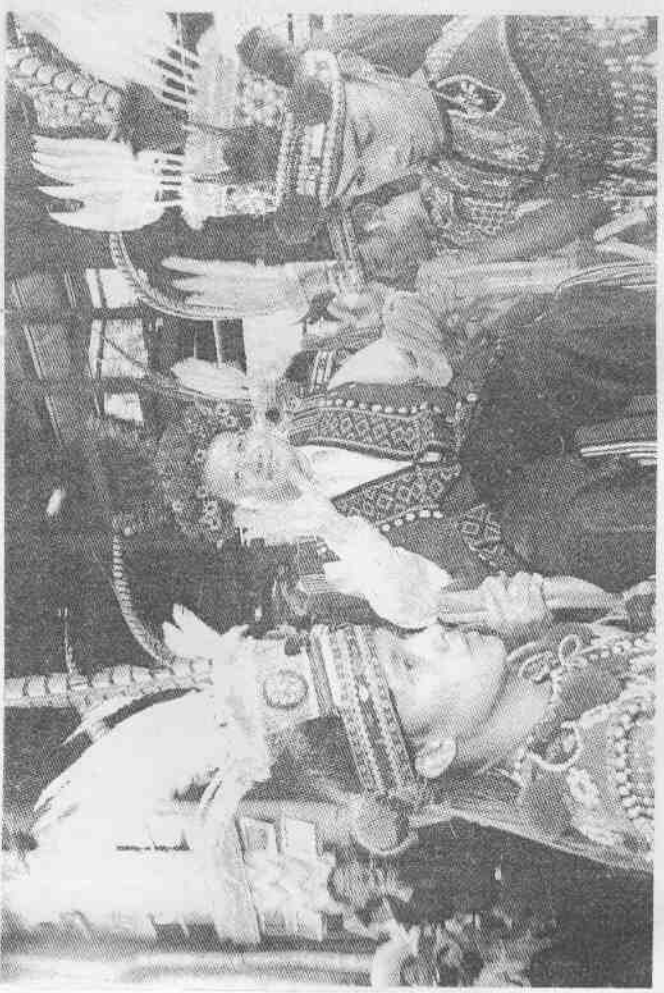
中國國家旅遊局長吳琪偉應台灣觀光協會邀請，在10月組團來台參訪。