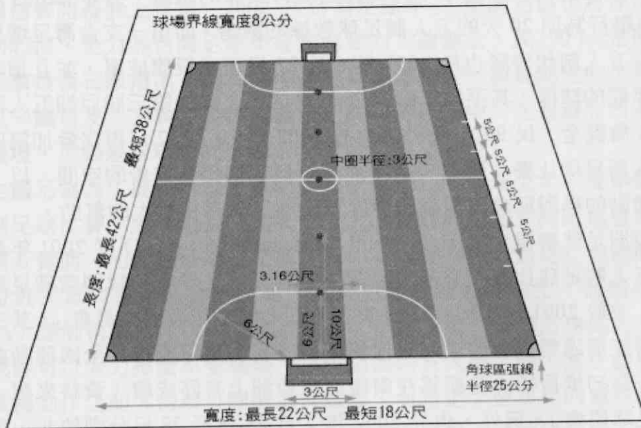
圖二、五人制足球場 1