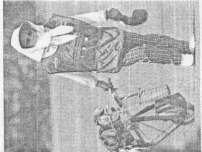
（圖：記者林正堃/文：記者趙新天）

北海岸連綿3天颶陽高照，選手揮汗如雨，桿弟也辛苦，平日開球車載客人，這回百齡盃台灣冠軍盃桿弟使用用手拉車，上坡下坡體力消耗更大。 由於桿弟每天都在戶外曝曬，為防皮膚過度傷害，她們上班幾乎都是從頭包到腳，在炎熱下，一不小心很容易中暑。昨天第3回合，名將汪德昌的劉姓桿弟就因為高溫造成身體不適，勉強撐完9洞，趕緊請同事緊急「上場