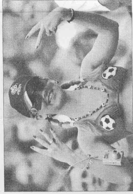
圖/歐新社、路透社 文/蔡裕隆

■世界杯足球賽英格蘭迎戰巴拉圭的比賽，伊莉莎白二世女王透過現場觀賽的威廉王子(上圖，美聯社)表達支持之意；首相布萊爾也在官邸為英格蘭隊加油，並首次掛上英格蘭的底底紅十字隊旗。