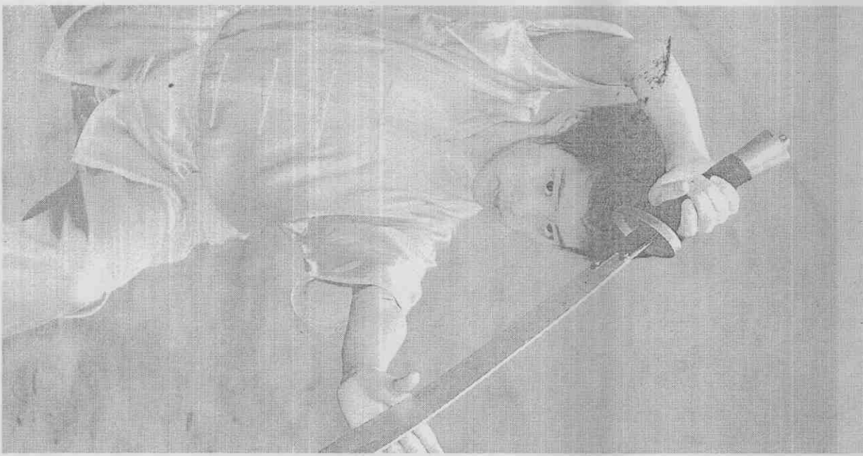
武術第一次列入世界運動會的比賽行列，對下一代學習武術的青少年學子是很大鼓舞。

比賽項目分為運動大項、分項和小項。《奧林匹克憲章》規定：只有奧林匹克運動項目才能列入奧運會比賽項目。並且還規定：運動大項、運動分項要列入夏季奧運會比賽項目必須有公認的國際基礎，至少在75個國家和4大洲的男子中以及至少在40