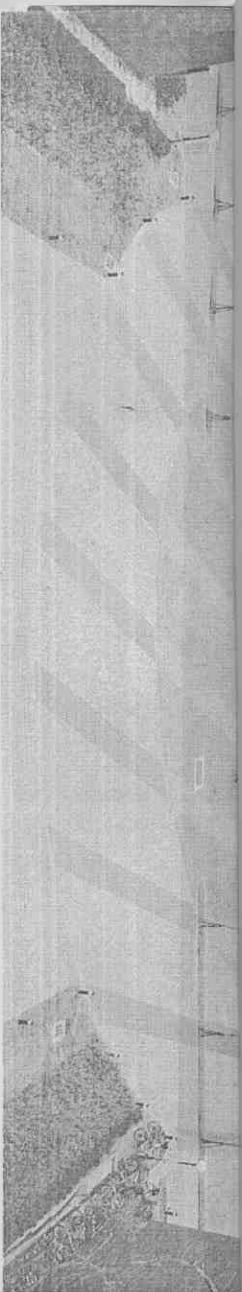
2009世界運動會即將登場，中山大學體育館將作為柔術及空手道賽場。圖左為體育館樓高3樓，位於世運健力賽場地邊仙館對面。