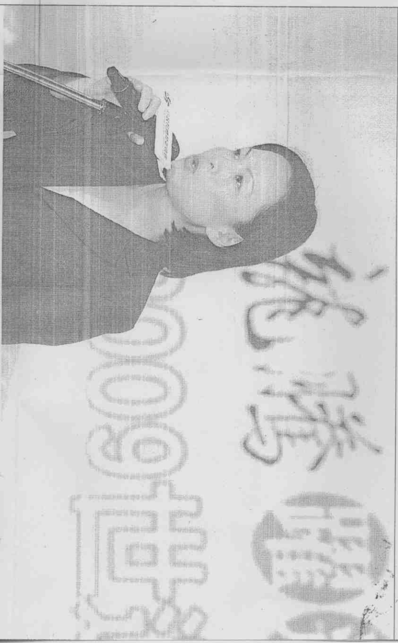
行政院體委會主委戴遐齡強調調办好世界運動會是眼下最高任務。