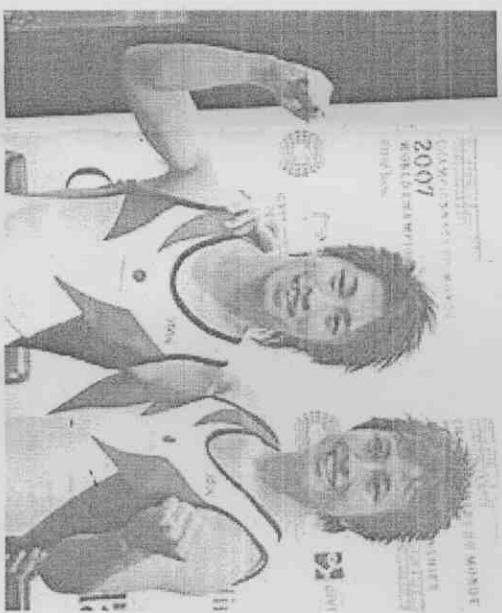
世界運動會的體操運動比賽，包括韻律有氧和韻律體操，都是比奧運還精彩的現代運動。

2016年奧運會的主辦城市將於10月2日在丹麥哥本哈根舉行的國際奧委會會議上揭曉，而入奧的兩個項目名單也將隨之出爐，其間的關係相當微妙。