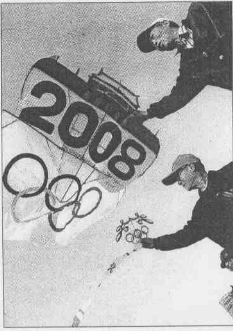
↑天津兩位老人在天津銀河廣場，放飛親手製作的「奧運風箏」。 ↓北京奧運會吉祥物昨天晚上在北京工人體育館出爐，五個吉祥物也隆重登場。

黨、政、體壇、藝術、設計及各界人士，對吉祥物候選作品進行評議，且對入選作品提出修飾與改良的意見，因此最後象徵「激情」、「歡樂」、「福娃」、「健康」、「幸運」的「五福娃」誕生，其實是許多人創意的結晶。