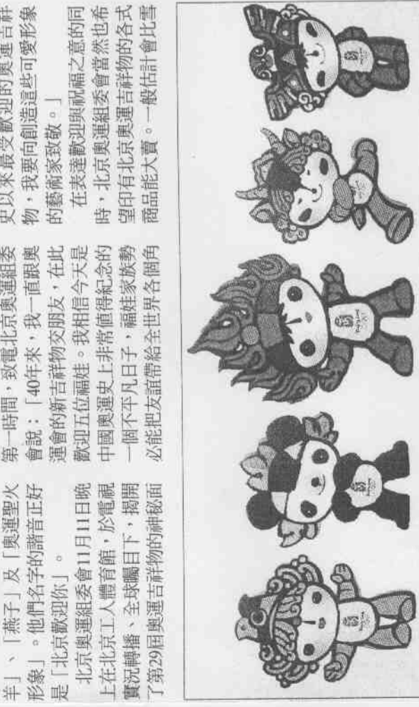
↑北京奧運吉祥物由魚、熊貓、奧運聖火、藏羚羊、燕子為創意的「中國福娃」組成。