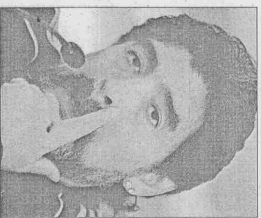
阿根廷隊教頭馬拉度納將是本屆世足賽話題教練，他昨天否認帶著足球流氓前進南非。

阿根廷足球流氓名氣雖比不上英格蘭，可暴力事件也不少，據非官方機構統計，自1924年來，與足球暴力有關的死亡人數已達241人。