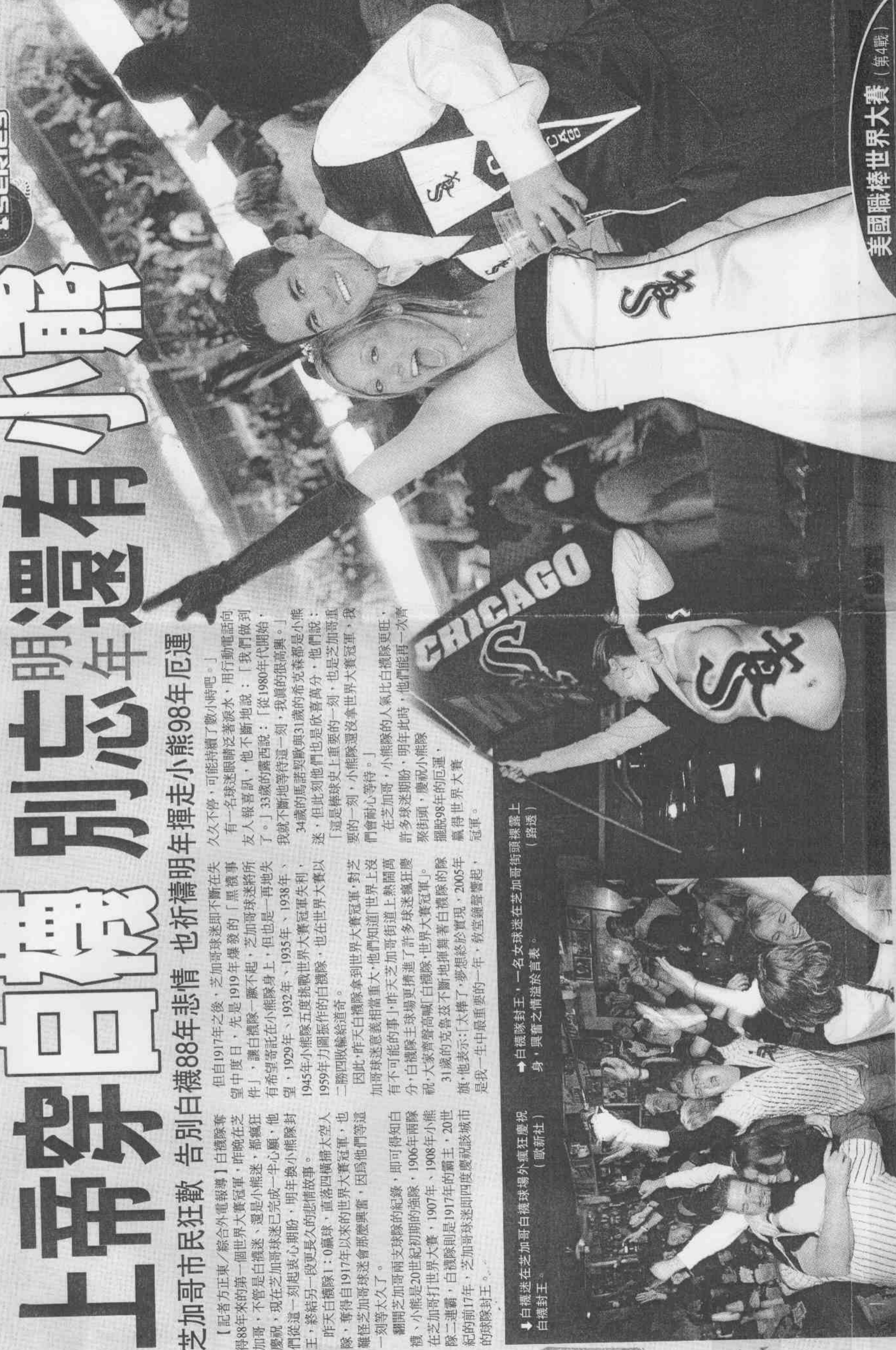
白襪迷在芝加哥白襪球場外瘋狂慶祝白襪封王。