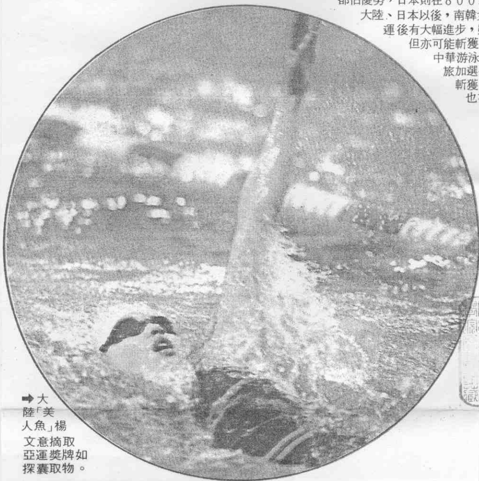
→大陸「美人魚」楊文意摘取亞運獎牌如探囊取物。