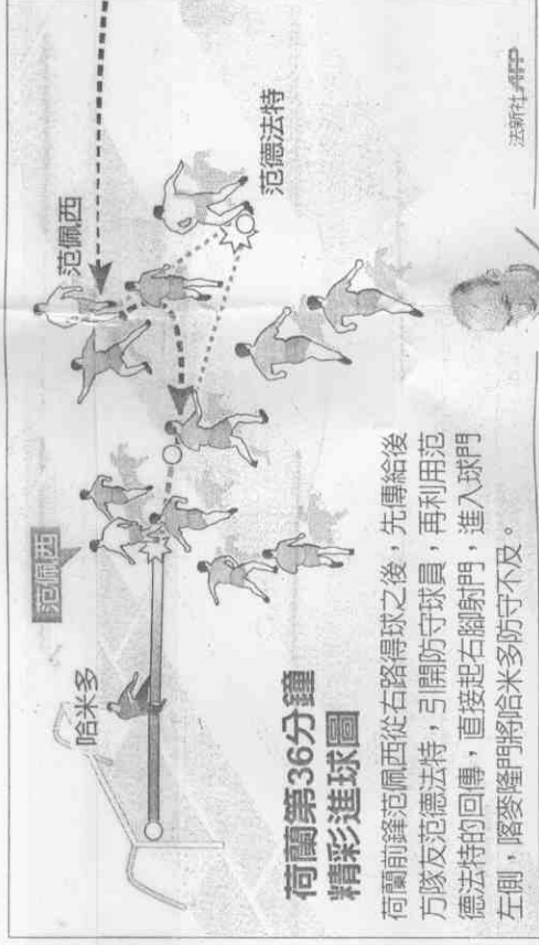
荷蘭第36分鐘精彩進球圖

穩晉級的荷蘭踢法也不消極，前鋒范佩西先進球後，「小飛俠」羅本則在第73分鐘替補上陣，展現積極踢法，雖射中門柱，但也間接為韓特拉爾製造第2顆進球的機會。荷蘭28日晚10點迎戰F組第2斯洛伐克。