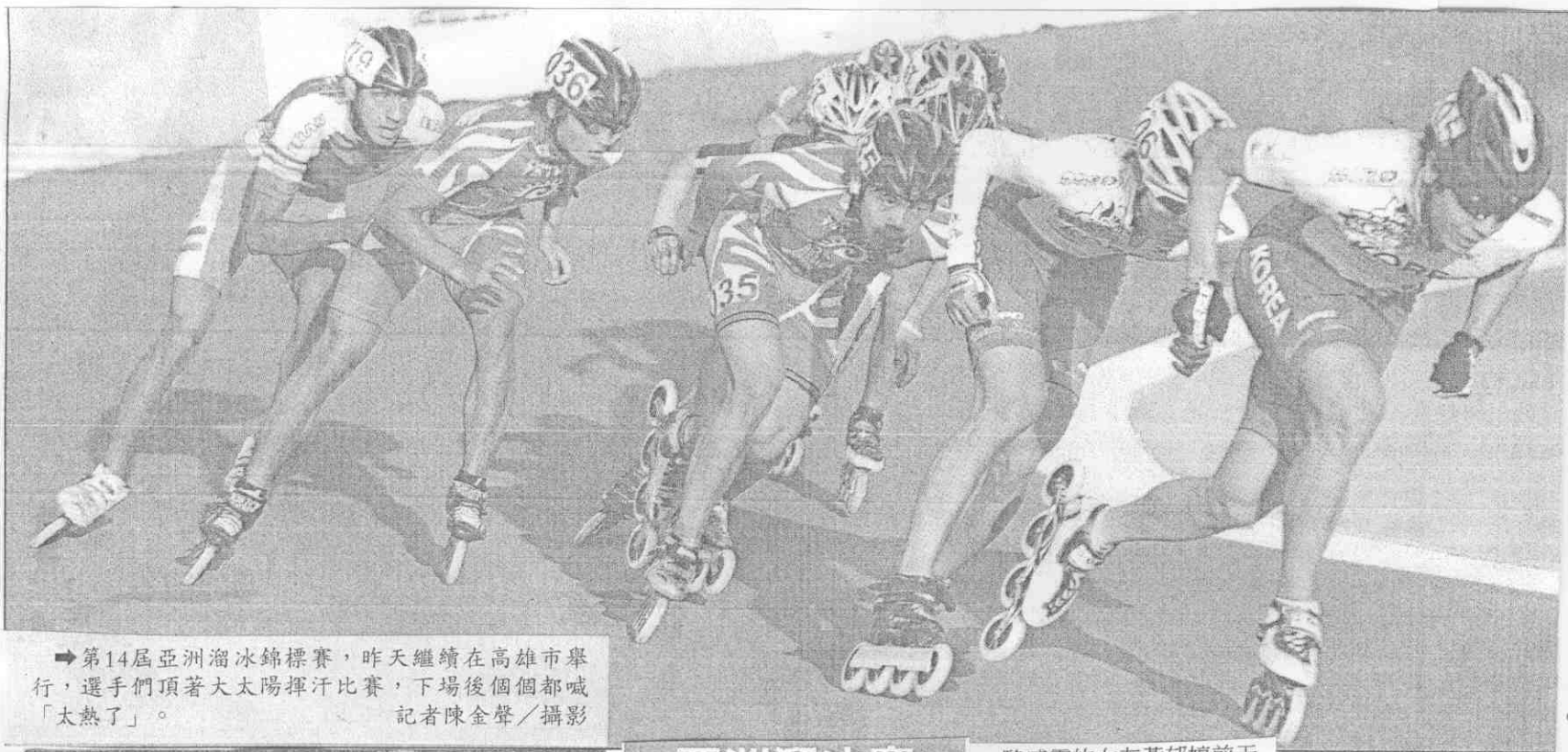
→第14屆亞洲溜冰錦標賽，昨天繼續在高雄市舉行，選手們頂著大太陽揮汗比賽，下場後個個都喊「太熱了」。