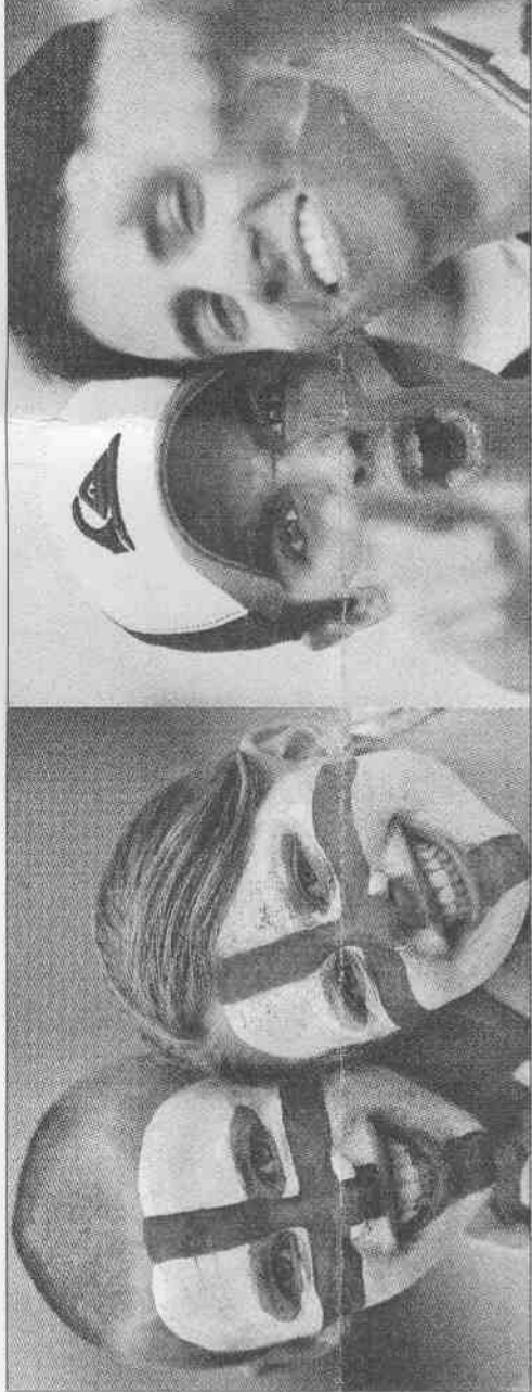
英格蘭與厄瓜多之戰，不但是場上兩軍交手，也是場邊球迷的大對抗，雙方球迷都早已準備好好加油一下。

與拉布魯克公司表示，今年英國人為世界杯投下的賭金總額將高達10億英鎊（約台幣595億元），是24年前上屆世界杯總賭金的5倍。今年賭盤和往年最大不同，是賭客可在球賽開始之後繼續下注。不變的是，搞笑賭盤一樣令人噴飯。貝克漢身負隊長責任在身，怎可在