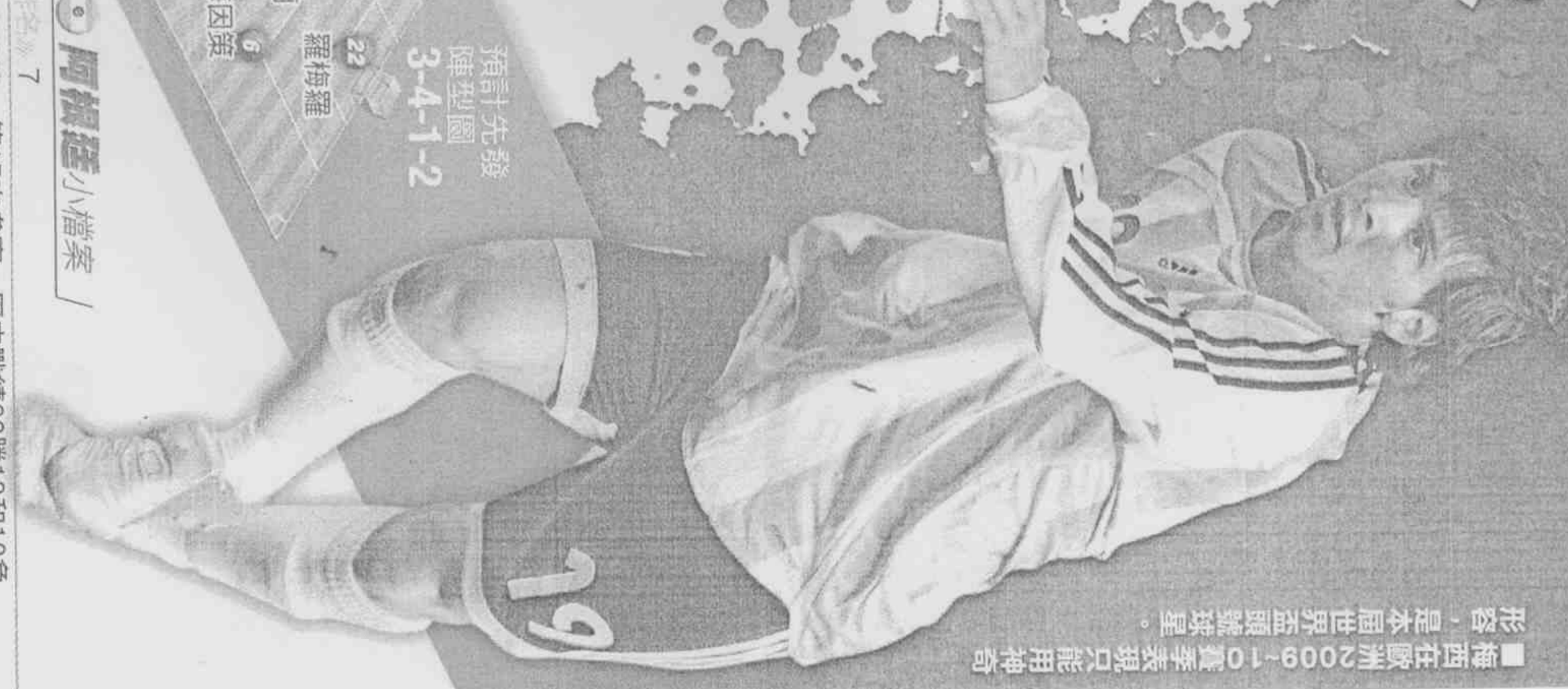
■梅西在歐洲2007-08賽季表現只能用神奇形容，是本屆世界盃頭號球星。

【黎建忠／綜合報導】南美勁旅阿根廷，從1930年首屆世界盃就開始參賽，拿過1978、86年2次冠軍，上屆德國世界盃止步8強，本屆由傳奇球星馬拉度納擔任教頭，去年「世界足球先生」梅西領軍，強大的前鋒攻擊陣容，被國際各大賭盤一致看好奪冠度第3熱門。 49歲馬拉度納，上次當教練是1995年在阿根廷首都布宜諾斯艾利斯的競技隊，但成績不佳，而且球員時期也是爭議人物，全球都在拭目以待，他如何能將個人出色的球技和特質，轉化為臨場督軍調度實力。 老馬帶兵 實前搞神秘 阿根廷已踢過2場熱身賽，分別以4比0勝海地、5比0勝加拿大，雖然對手實力不強，但強大攻擊火力仍是阿根廷本屆倚重戰力。只是抵南非後，球隊都未安排熱身賽，甚至練習時讓梅西後衛，馬拉度納的練兵思維令人難捉摸。 23歲、169公分的梅西，是馬拉度納欽點接班人，5歲啟蒙，8歲加入阿根廷紐維爾隊足球俱樂部，13歲加入西甲勁旅巴塞隆納，18歲獲世界青少年足球錦標賽冠軍、進球王及MVP，去年幫巴塞隆納取得歐冠聯賽冠軍，是本屆金靴獎熱門。