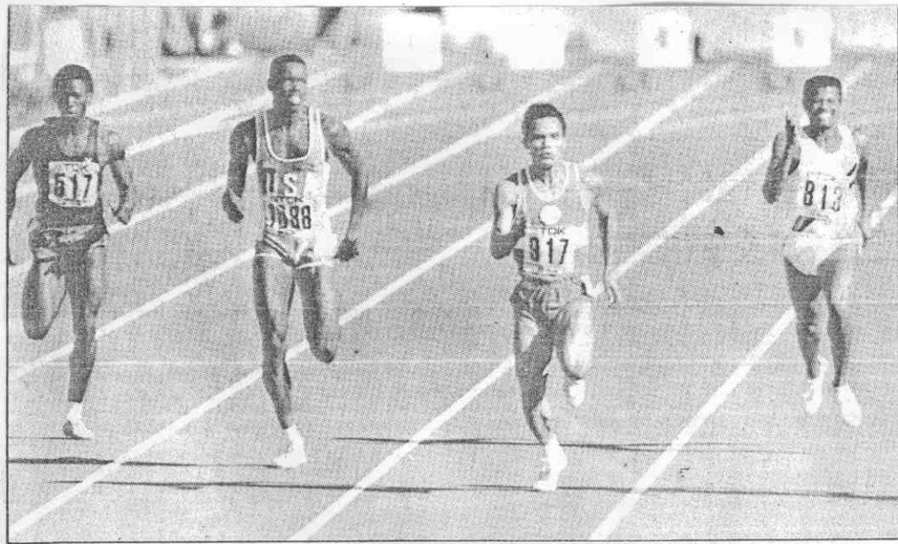
(真傳馬羅岩少林 者記派特報本)。級晉績成一四秒十以中賽預尺公百子男在福新鄭