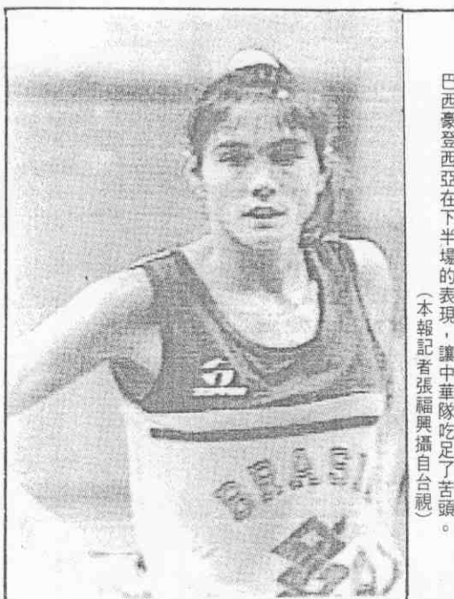
巴西麥登西亞在下半場的表現，讓中華隊吃足了苦頭。

中華隊由這段時間至上半場結束前五分卅秒，是演出較正常的時候，朱彩鳳三分球，黃玉蘭轉身跳射，維持中華隊領先局面，但巴西隊在五分鐘一記罰球後，廿二平手，中華隊西亞又罰又切，卅九比卅二，巴西又把差距拉大。