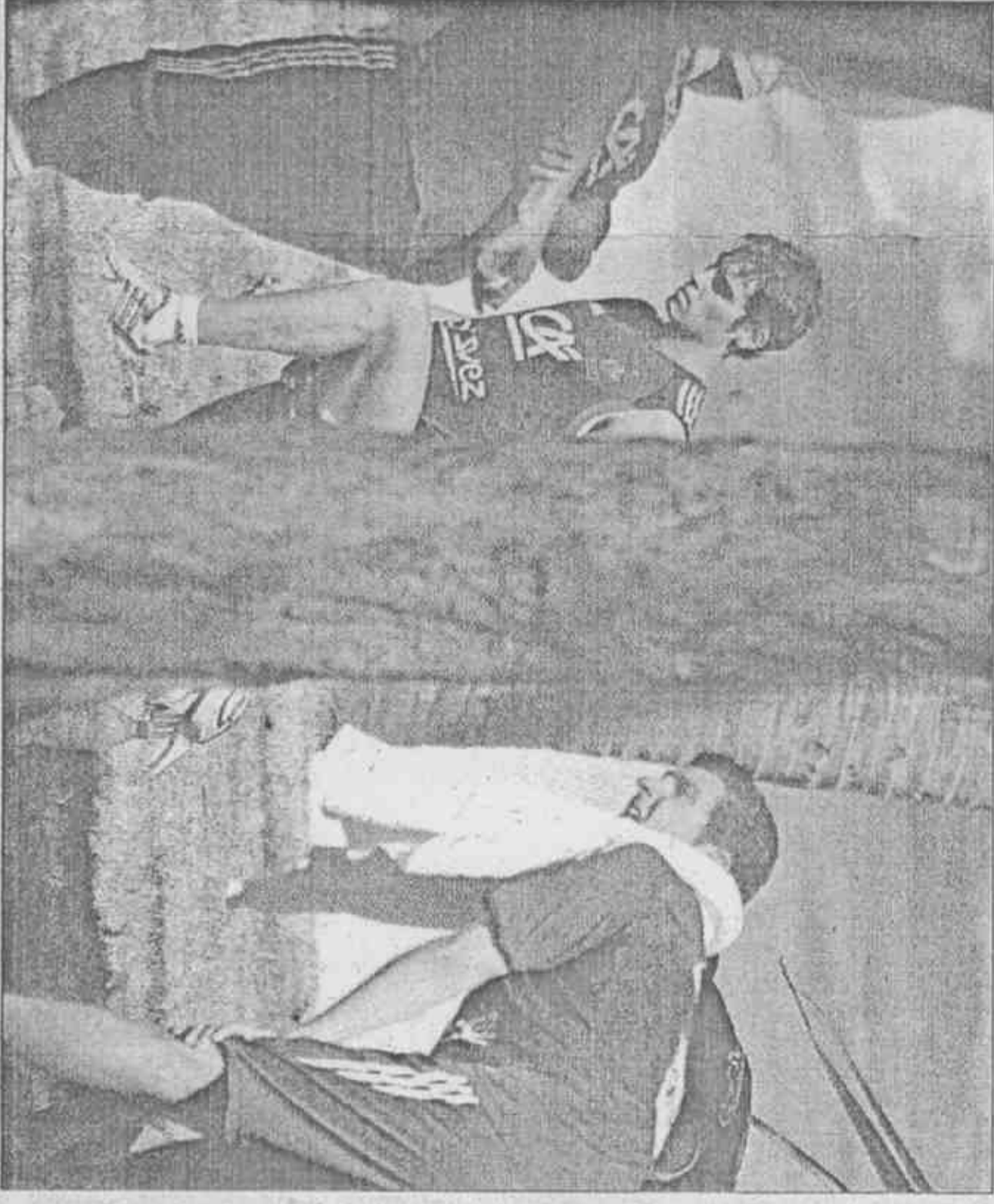
法國隊訓練營拉到印度洋上、非洲東方的留尼昂島，在海景與椰影揮汗備戰。

本報記者 楊育欣 去年分組出爐後，英格蘭媒體與球迷笑得燦爛，因為他們抽中上上籤，面對同組美國隊、阿爾及利亞隊與斯洛維尼亞隊，分組第一是「三獅軍團」英格蘭囊中物，剩下1張16強門票，就由他們爭搶。 現在就有球迷直接把目光鎖定D組可能的16強對手，英格蘭是本屆冠軍熱門隊伍之一，花重金找來名教頭卡佩羅，他上任這兩年來，國際賽成績出色，16勝4負2和，世界杯資格賽時也寫下9勝1負，為球隊 近年資格賽罕見佳績。陣中不乏球星，魯尼、蘭帕德、傑拉德、奈瑞與費迪南等人，問題在沒有出色門將，這點也令卡佩羅擔心。 卡佩羅把目標擺在13日首戰，務必擊敗美國隊，「只要這場贏，第2場後就會比較輕鬆。」他指出這組最需要提防就是美國。 美國媒體對這次世界杯國家隊亮相有信心，由於去年聯合會杯踢進決賽才敗給巴西，不少分析預測肯定晉級16強，甚至可以走得更快。 兩支從附加賽晉級隊伍，阿爾及利亞經過浴血奮戰擊敗埃及隊，斯洛維尼亞則爆冷擊敗名教頭希丁克領軍的俄羅斯隊，賽後斯洛維尼亞總理帕赫爾還為球員擦鞋。 兩隊目標都寫著世界杯最佳成績，突破首輪，可是分到C組，有英、美擋在前面，離南非最近的阿爾及利亞恐怕會先打道回府。 斯洛維尼亞只要發揮附加賽拚鬥精神，拉下俄羅斯那種能耐，很有可能再次分演「灰姑娘」，關鍵會是在頭兩場面對阿爾及利亞與美國。