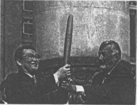
聖火火炬用錢買，北京代表團搶著要。