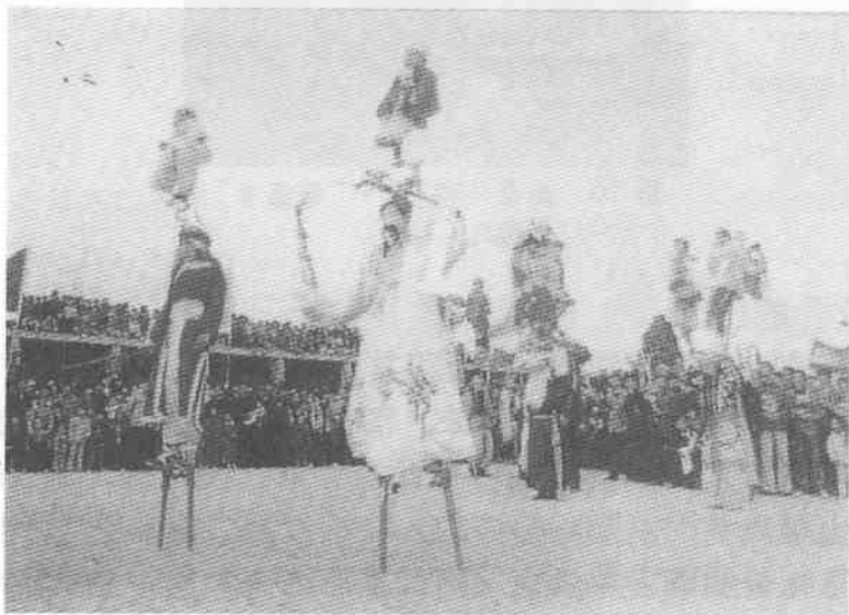
圖 9 河南高蹺 托裝

河南高蹺，表演者可以踩在高蹺上扮演「肘閣」，當地稱之為“托裝”。所謂“托裝”，即舞者把鐵製的特殊道具綁在身上，另將一、二名兒童綁在道具的上端，形成如用手托起的各種造型（圖 9）。