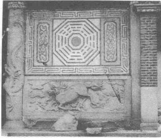
圖1 泉州文廟大殿壁上的陰陽八卦圖

正因泉州的地理環境與歷史文化特殊，從而形成泉州民間舞蹈具有多種因素、多種類型，及多種色彩等三大特點。