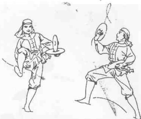
圖 13 鏡舞 湯繼明、鄭岩松 繪圖

泉州地區的「鏡鈸舞」稱作“扔鏡鈸”，屬於道教的舞蹈形式，也是道教積功德，為超度亡魂而進行的祭奠儀式。其動作有“轉鈸”、“飛鈸”、“頂鈸”、“繞鈸”、“鑽火圈”、“高竿頂鈸”、“踩高蹺”等驚心動魄的高難度動作，但目前多已失傳，目前尚保留的動作有“拋鈸”、“右輪鈸”、“直如送”等。表演者大多是道士，由家族代代相傳，至今已有五百多年的歷史（註 30）。