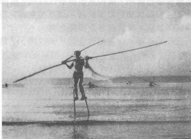
圖 8 廣西京族漁民踩著高蹺捕魚

「高蹺」起源於勞動生活的說法，在古文獻及現實生活中，都可以找到依據。如郭璞對《山海經》長股國的另一條註釋中說：「長股國人的身體像常人，但臂長三丈，或曰，長腳人常負長臂人入海中捕魚也（註 23）」。從這段描述中，我們不難想像出腳上綁著長木蹺，手持長木，製成的原始捕魚工具，在淺海捕魚的形象。而更令人感興趣的是，今日居住在廣西防城縣海島上京族，卻仍有踩著高蹺在淺海撒網捕魚的風習（註 24）（圖 8）。