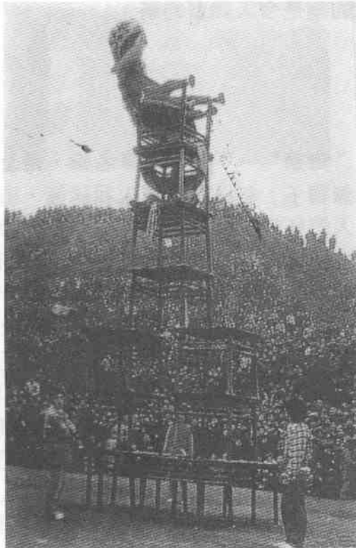
圖7 四川七層高台 獅舞