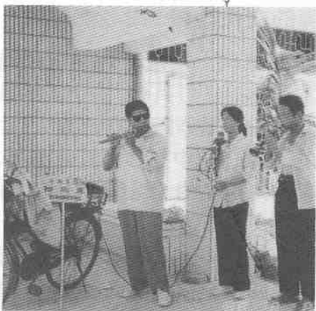
圖 6 拍胸舞樂隊

閩南「拍胸舞」，以雙手“打八響”作為基本動作，表演時，腳下以不同的步法相配合，其步法有小跳步、蹲襠步跳、十字步、青蛙跳等即興表演。過去「拍胸舞」一般是自唱自跳（或不唱），現在多用民樂伴奏，並且根據不同的表演形式而有不同的曲調，例如「踩街拍胸舞」，是喜慶佳節時，由許多人一起表演的。動作比較有規範，隊形簡單，以閩南民間樂曲《樂開懷》為伴奏。「酒後拍胸舞」的表演是以“十字步”為主，人們酒興，圍圓圈拍打起舞，左擺右晃，醉態中別具風味。「乞丐拍胸舞」，是邊舞邊唱《乞丐歌》，表現過去乞丐以表演拍胸舞乞討時，那種饑寒交迫，求人同情施捨，甚至略帶顫抖的動態形象。「拍胸樂」，是指豐收時，人們在田間空地，即興拍胸表演，舞者多以“蹲襠步跳”為基本動作，“打八響”的同時，不斷的擺動頭部，幅度大，速度快，洋溢著喜悅之情，表演時多用南音的樂器伴奏，樂曲採用古老的南音曲目《三千兩金》，地方色彩濃郁。