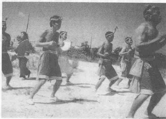
圖5 拍胸舞

《中國民族民間舞蹈集成·福建卷》中關於「拍胸舞」已有詳細的論述，他們把閩南各地的「拍胸舞」分為「踩街拍胸舞」、「酒後拍胸舞」、「乞丐拍胸舞」以及「拍胸樂」等四種表演形式；歸納、整理出多種基本動作，並把它作為該卷的首篇，可見此舞在福建民間舞蹈中佔有極其重要的地位。