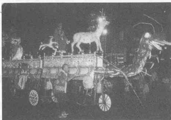
圖3 台灣蜈蚣陣

現今臺灣的「蜈蚣陣」，則把兒童裝扮成戲曲中的人物，再與各種彩燈相結合（圖3），製作工藝極為現代化，又將聲、光、電相結合，頗為精緻美觀，人物造型栩栩如生，意境深邃，引人入勝。遊行時，早已改用汽車代替肩扛，各家別具匠心，別出心裁，使臺灣「藝閣」更為光彩奪目，若與閩南地區的「蜈蚣閣」、「燭橋燈」相互比較時，不難看出兩地之間的源流關係，若就探索「藝閣」源流而言，應是由中原傳入福建，而又從閩南傳入臺灣；隨著臺灣經濟的發展與改變，才有今日之盛況。