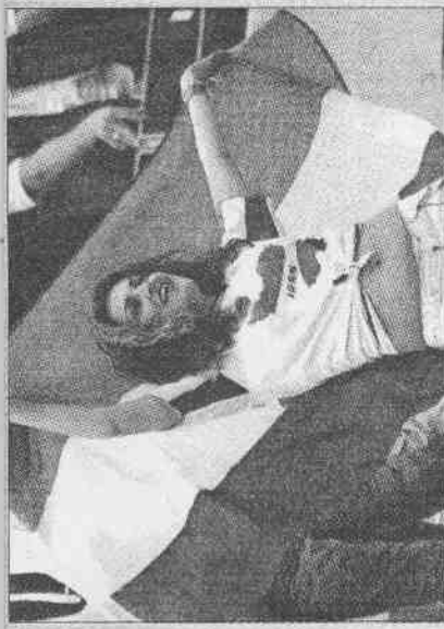
▲保守的伊朗隊也有美少女清涼加油，打扮雖無法和歐洲球迷比擬，不過也相當不容易了。