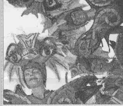
▲葡萄牙將拉丁人專有的嘉年華會搬到世足，五彩繽紛。