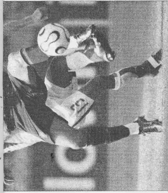
▲葡萄牙小羅納度(前)出腳時，被伊明卡比環腰一抱，動彈不得。