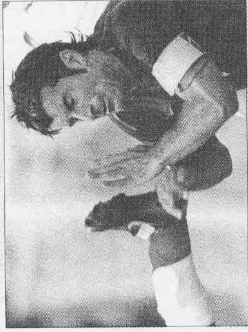
▲葡萄牙球星菲戈，被一位伊朗球員以犯規動作，鞋掌長釘打臉，皮破倒地。

做爲葡萄牙的中場靈魂，迪科負責的組織、執行戰術與縱橫連繫的角色非常吃重，這也是葡萄牙巴