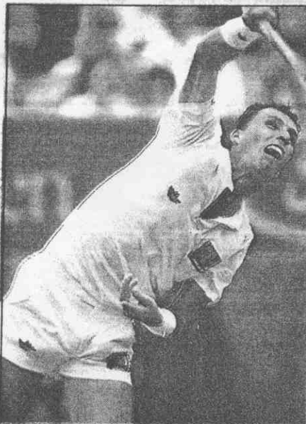
。電若快球發道藍，手殺面冷↑

比賽訂廿五日晚間七時在台北體育館舉行，入場券分為三千元、二千元、一千五百元、一千元四種，學生憑證優待五百元，可於愛迪達忠孝店、愛迪達忠誠店、優仕達有限公司、鴻源百貨、力霸百貨、遠東百貨寶慶店、金石堂公館店預購門票。或電詢(〇二)七八一七七八、七八三三五八四。