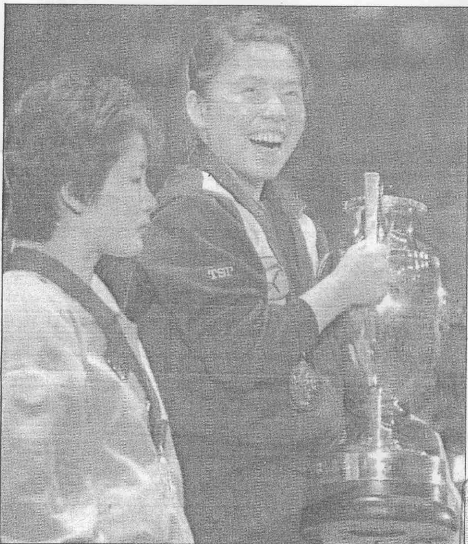
↑大陸選手鄧亞萍(右)，5日高興的舉著世界杯桌球賽女子單打冠軍獎杯，她在決賽以21：13、21：18、21：14擊敗韓國李芬姬。