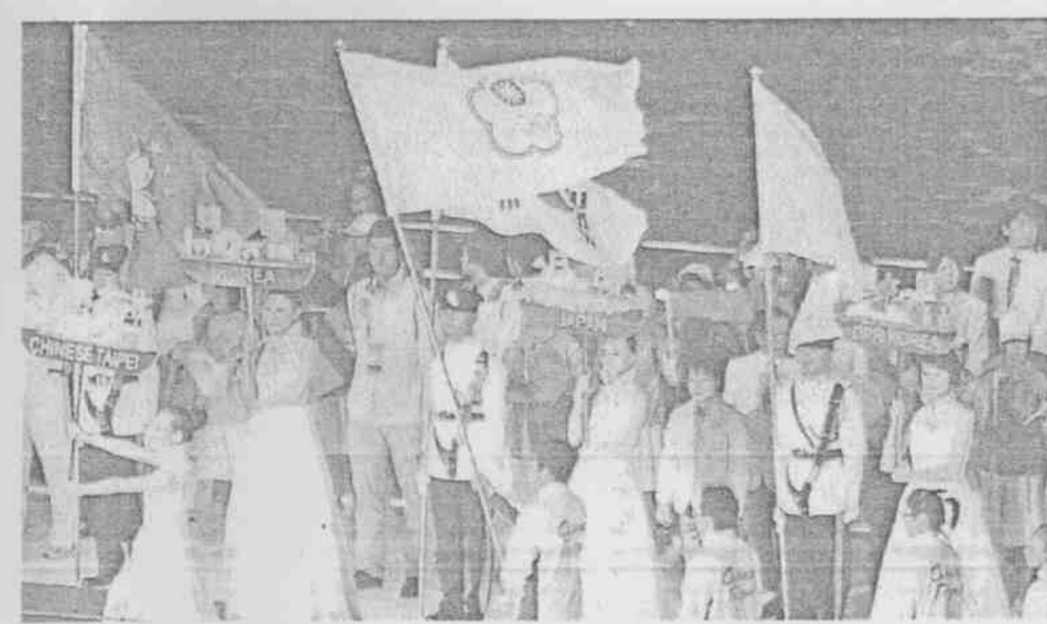
東亞運開幕典禮，中華代表團在海上舞台進場，感受新奇。

東亞運開幕式重創意，以港口作舞台，運用灣仔、中環海岸線形成最大舞台背景，維多利亞港附近區域，可以容納近30萬觀眾與運動員互動，打破很多傳統運動會開幕式的模式。