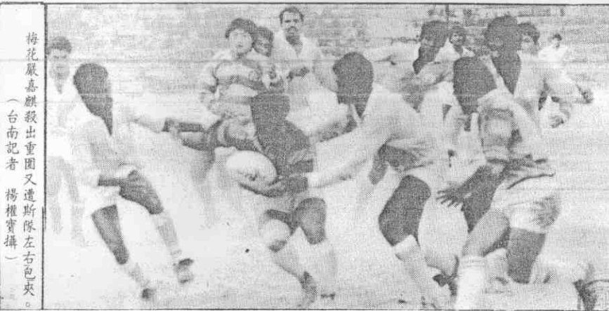
梅花隊前鋒龍金余（者套頭戴）勝其拉規犯隊斯球邊爭搶

奪得選拔賽冠軍的茉莉花，只能安插兩名在校生，在封王後參加保送考試，而茉莉花對這項限制不以為然，多次要求增加均被擱置。 剛好長榮此次投效彰縣隊伍中，安插了十名在校生，在今年與南市冠軍戰時，其中七名曾下場，順理成章拿到了保送權，相形之下，六信茉莉花只有兩位，茉莉花抓住這一把