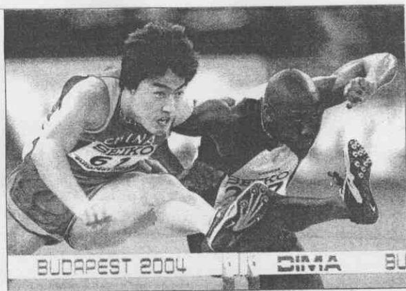
BUDAPEST 2004 DIMA BU