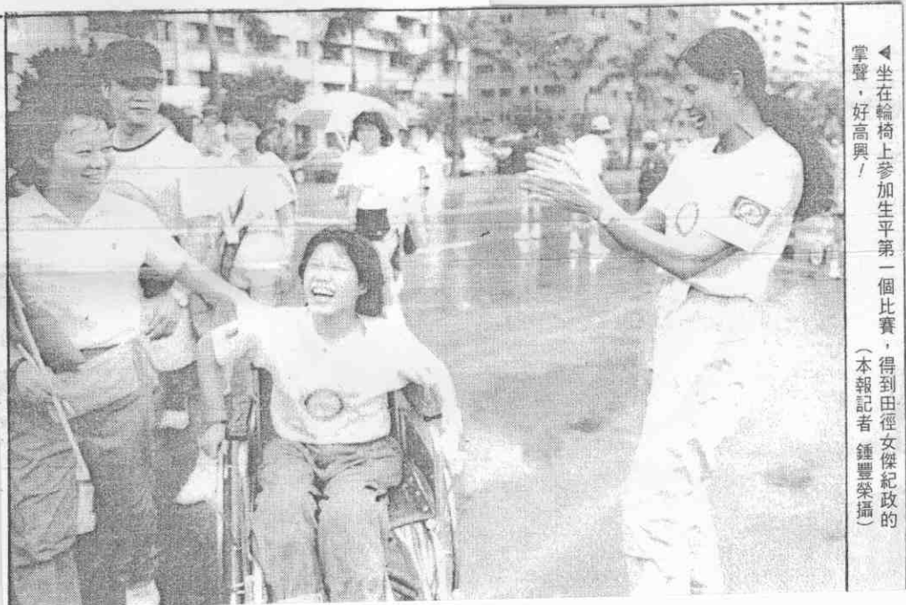
◀坐在輪椅上參加生平第一個比賽，得到田徑女傑紀錄的掌聲，好高興！