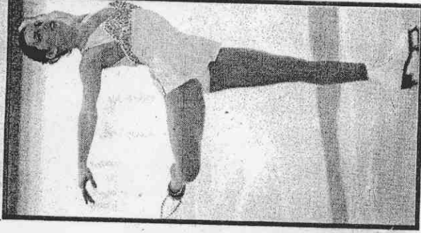
↑克麗岡廿六日在花式滑冰賽程結束後，表演拿手曲目。