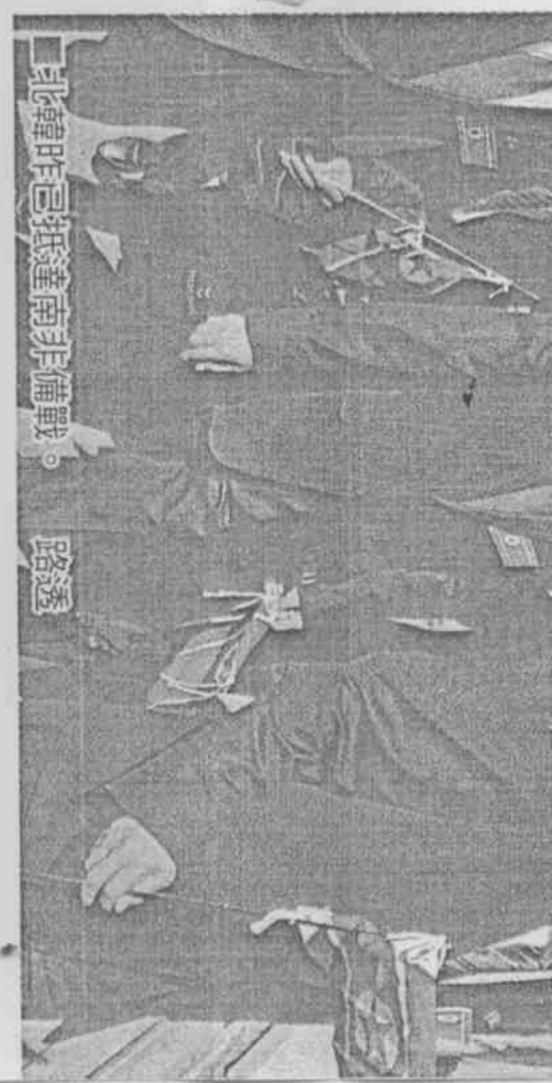
■北韓昨日抵達南非備戰。