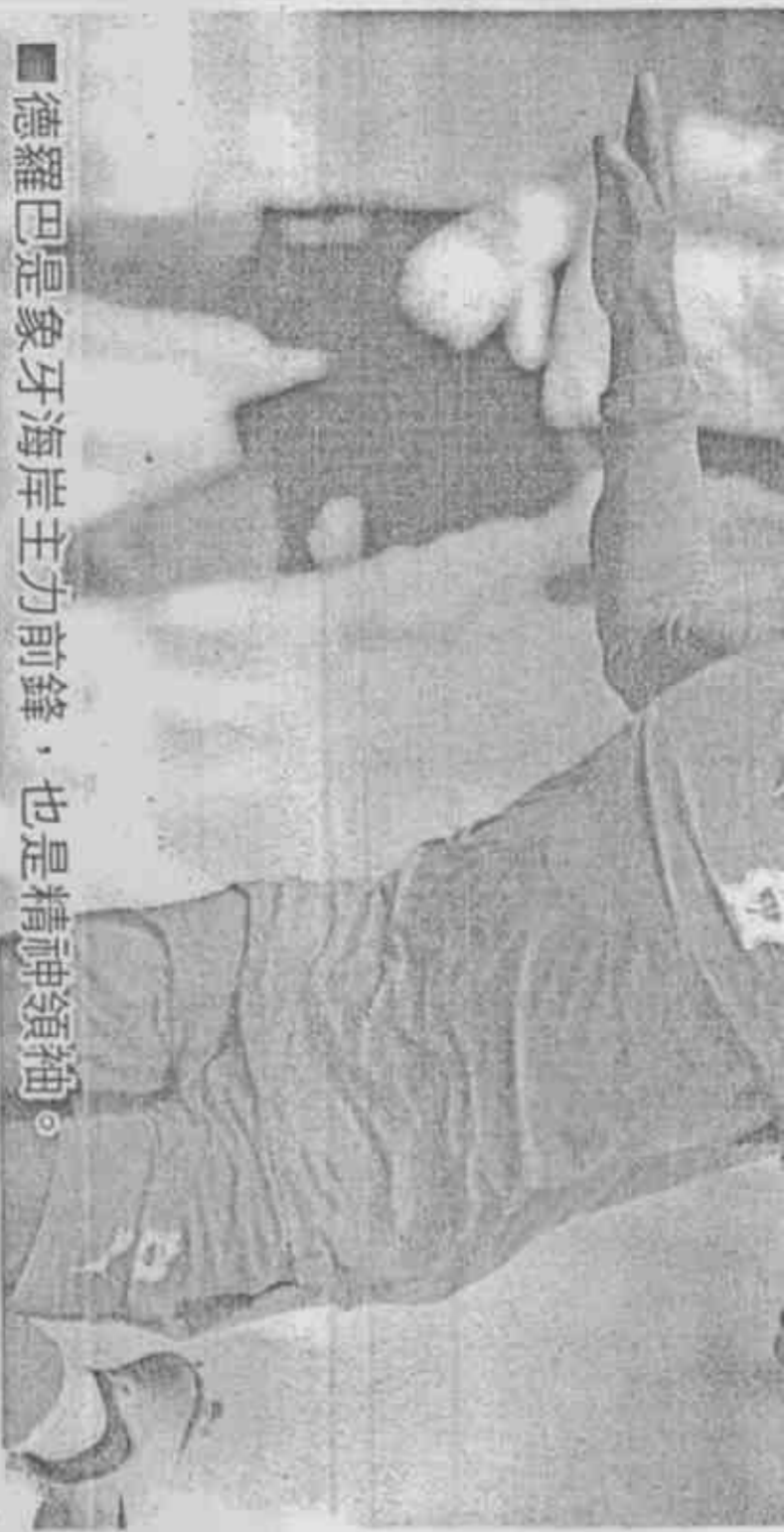
■德羅巴是象牙海岸主力前鋒，也是精神領袖。