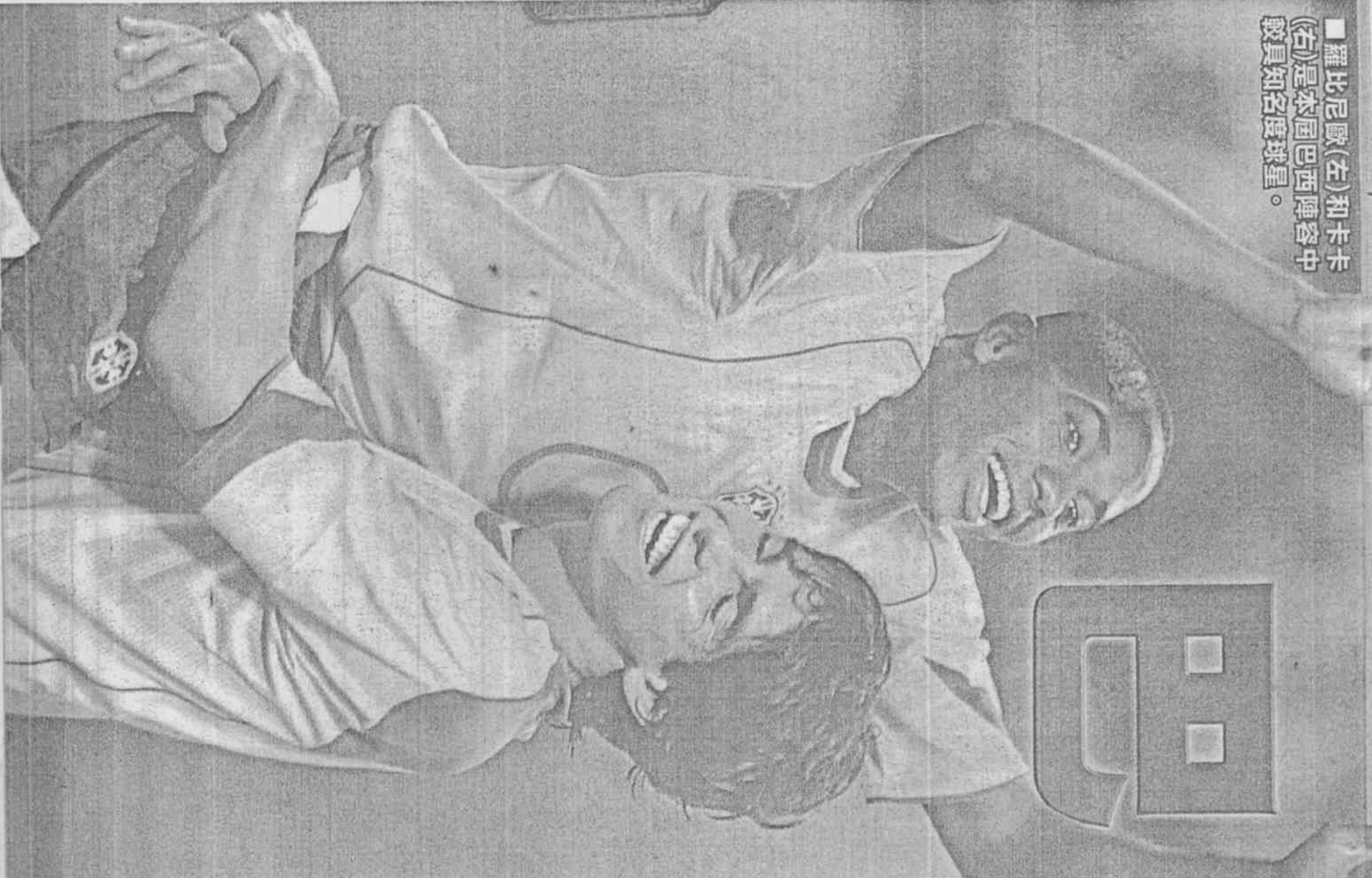
羅比尼歐(左)和卡卡(右)是本屆巴西陣容中較具知名度球星。