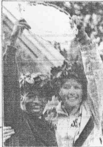
↑贏得今年紐約馬拉松男女組冠軍的伊坎加(左)與克莉絲婷森(右)，於奪標後戴上桂冠，合影慶祝勝利。