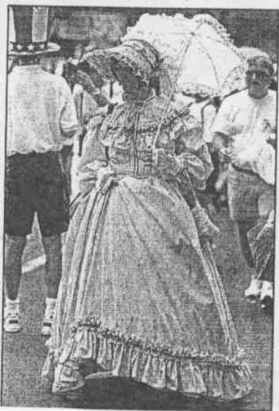
圖 / 鍾豐榮 文 / 宮泰順

亞城天氣燠熱，一位美國女觀眾穿著清涼上衣還嫌熱，一位廠商拿著消暑器向她身上噴水消暑，引來電視攝影記者攝影存證。