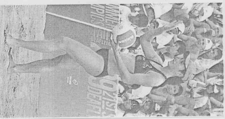
烏克蘭歐諾卡洛球技、人緣好，與搭檔贏得沙灘排球金牌。