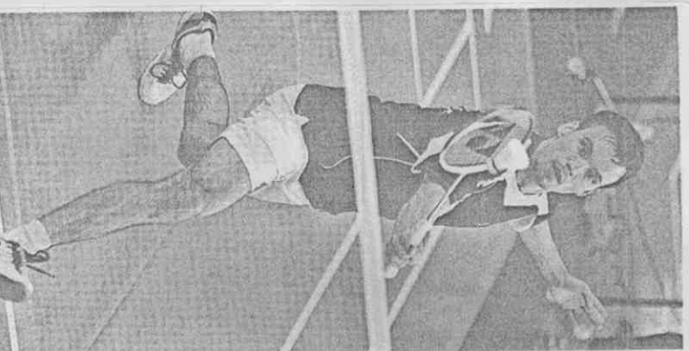
俄羅斯卡波夫囊括羽球男單與男雙2面金牌。